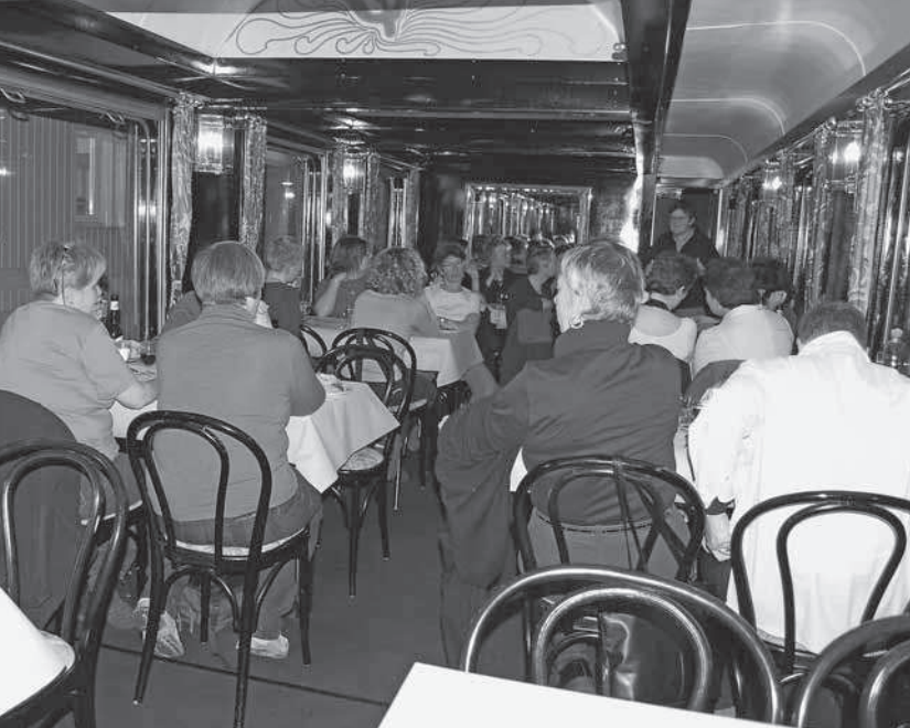
Nostalgie-Stimmung am Fest der LOS für die Helferinnen im Jubiläumsjahr

Begrüssen, Umarmen und Hallo-Sagen. Der Zug fährt übrigens mitten auf dem Dorfplatz – so was hat Frau aus der Stadt noch nie gesehen.